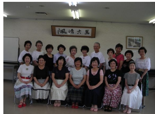
はまなすのみなさん

定期的に会場が確保でき冷暖房もあるので快適だそうです。新会員さんも募集しているようですので皆さんも遊びに行ってください。